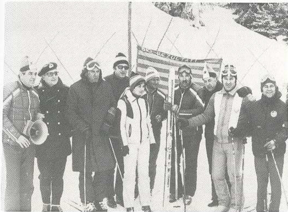
SSK kao organizator Armijskog prvenstva na Jahorini 1978.