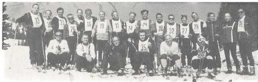
Učesnici tradicionalnog takmičenja na kraju sezone

ta 1979. godine, smučari i smučarke Smučarskog kluba Sarajevo postigli su slijedeće zapaženije rezultate: