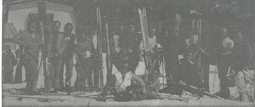
Takmičari i rukovodioci Kluba na Republičkom prvenstvu 1977.

Smučarskog kluba Sarajevo dominiraju u republičkoj konkurenciji. Na 31. republičkom prvenstvu, održanom na Jahorini od 25. do 27. februara 1977. godine, vjerovatno je postignut rekord po broju trofeja koji su pripali jednom klubu.