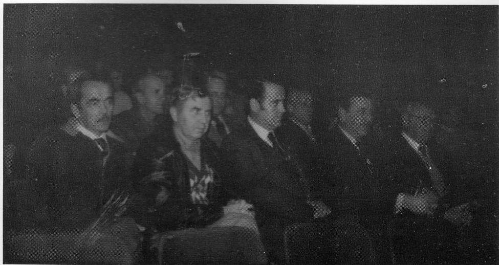
Sa Godišnje konferencije