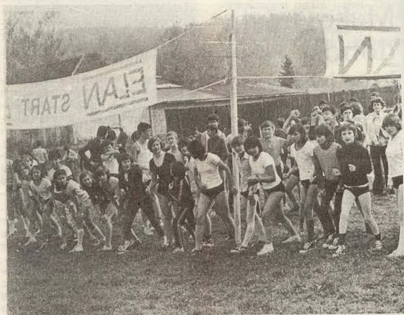
Kros za izbor budućih smučara trkača

Po mišljenju Vlajka Petrovića za smučanje u ovom kraju bitno je proširiti broj disciplina (klizanje, bob, sankanje...); uslovi za to se stvaraju i ovaj sport će dobiti novi zamah među mladima komune koja ima bogatu sportsku tradiciju.