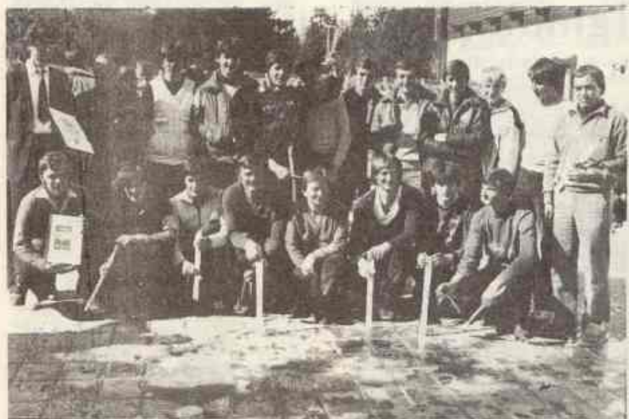
Najbolji biatlonci u Jugoslaviji – SK »Romanija«