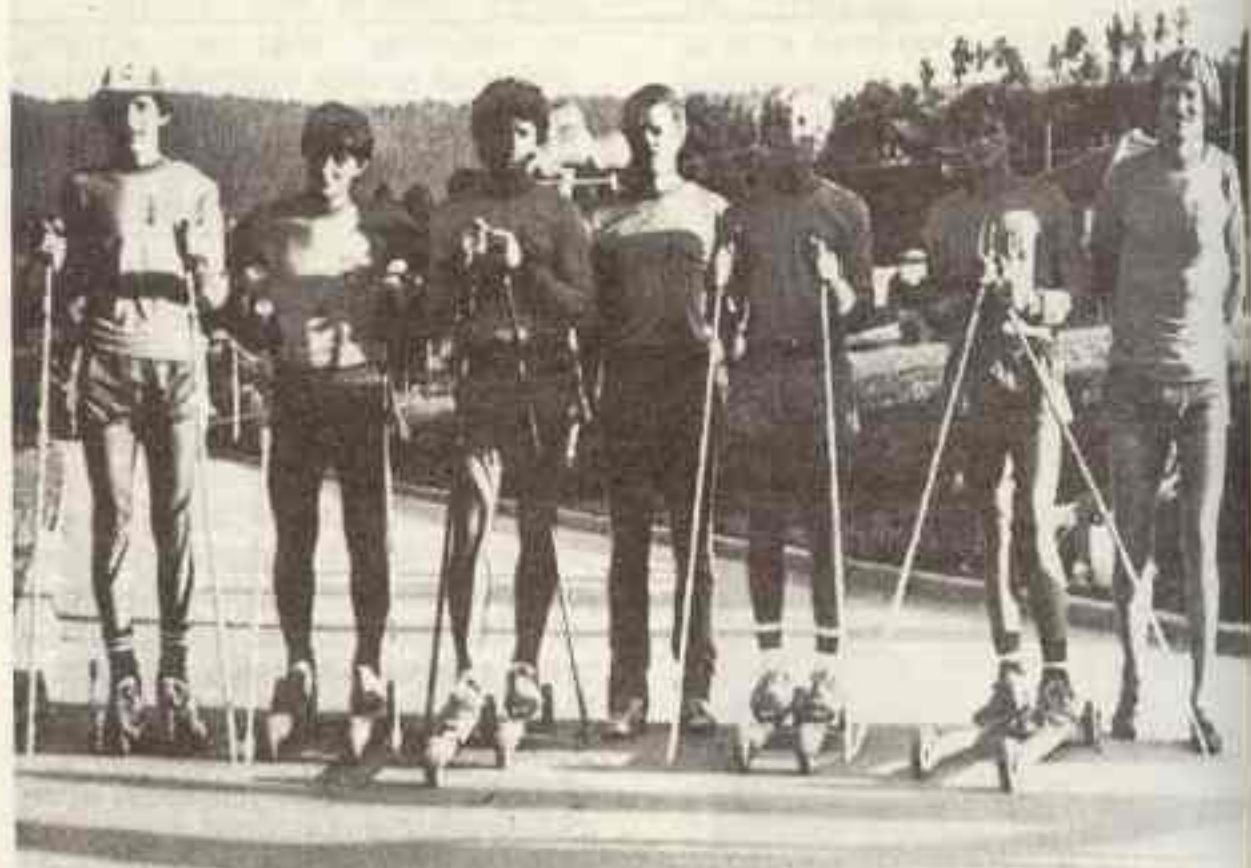
Smučari «Romanlje» na suvom treningu 1981. godine

kraju se trči jedan kilometar i ulazi se u cilj. Na tom takmičenju imao sam samo jedan promašaj. Slovenac Vodnika bolje je trčao od mene, ali sam ja bolje gađao i osvojio prvo mjesto. Prije te trke imao sam dug put i bio sam umoran što je uticalo na moj rezultat.