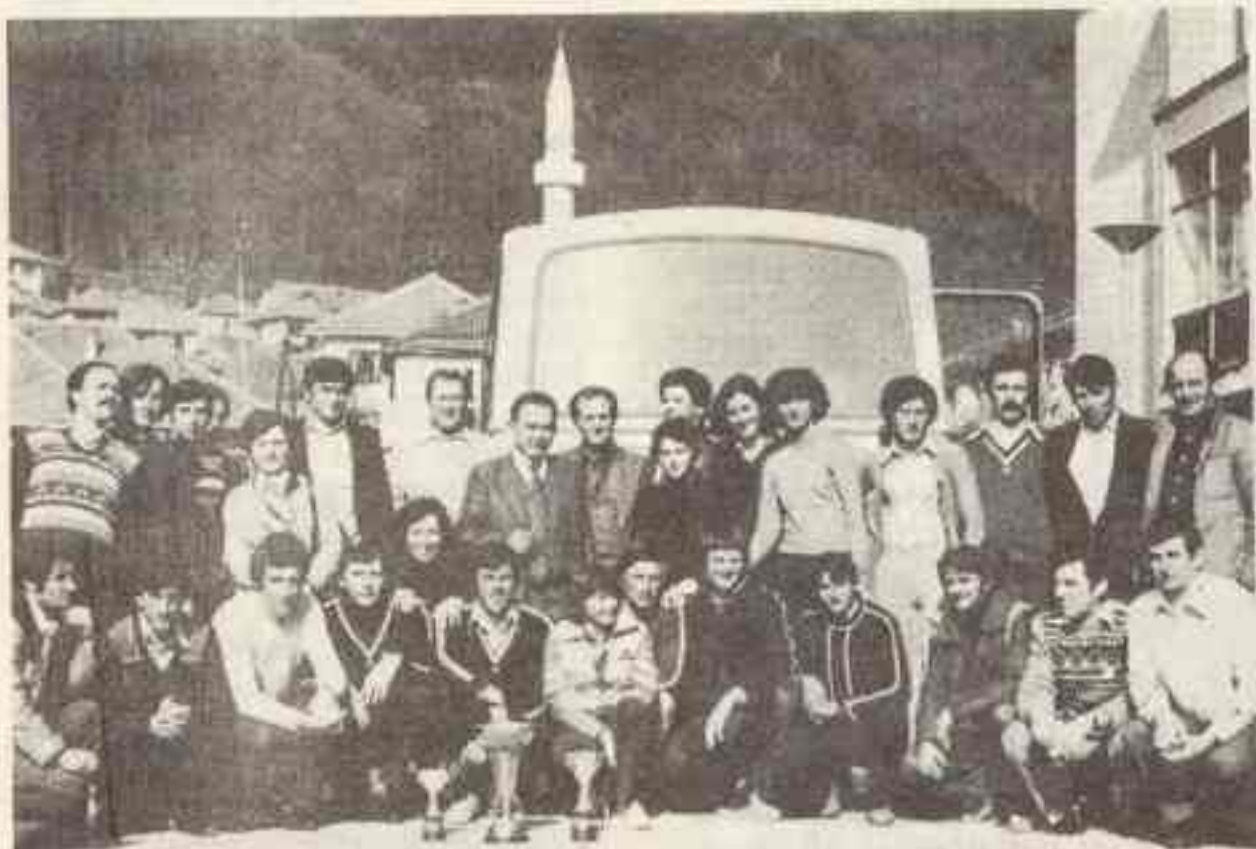
Pobjednička ekipa »Romanije« na Igrama radnika šumarstva Jugoslavije na Žabljaku 1979. godine