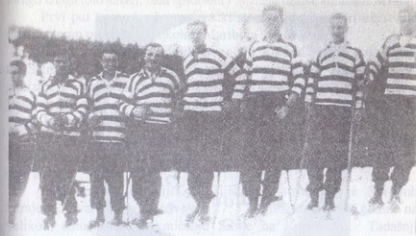
sl. 52: S. K. "Slavija" 1933. (Pale)

1928. godine organizovano je prvo takmičenje po pravilima Jugoslovenskog zimskog — sportskog saveza na Koševu. Učešće na ovom smučarskom takmičenju preuzele su ekipe: SK "Slavija", SK "Sarajevo" i vojnici SK "Kalinovnik".