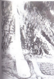
sl. 69: skakaonica Planica

nastupom i uspešnim rezultatima u Zakopanima (Poljska) 1934. (Franca Palme 54 metara), pristupa se završetku izgradnje smučarske skakaonice na Planici 1934. godine, pod vodstvom ing. Stanka Bloudeka. Skakaonica u Planici posle mnogo peripetija, kao i zabrane upotrebe 1935. godine od strane FIS-a, legalizovana je tek 1948. godine.