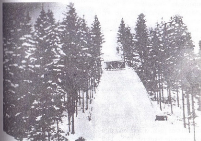
sl. 67: skakaonica na Palama, 1933.

Uvidevši svoj slab plasman, da zaostaju za drugim zemljama, smučarskih skakača država (Kraljevina Srba Hrvata i Slovenaca) na