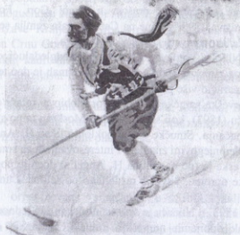
sl. 48: Crnogorac na smučkama po Angellu iz 1893. godine

takvi preduslovi, danas predstavljaju temelje za kasnije bavljenje sportovima na snegu.