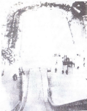
sl. 71: na zaletištu

Prvi probni skokovi obavili su se marta 1934. godine.