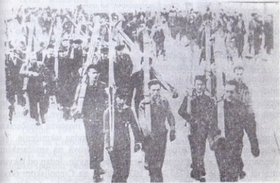
sl. 50: smučarski defile 1 sleta ulicama Sarajeva

Januara 1937. godine na Jahorini, "Jugoslovenski zimski-smučarski podsavez" organizovao je smučarski kurs jugoslovenskog značaja. Pravo učešća na ovom kursu imali su smučari — SOKOL-a, i iz cele Jugoslavije. Na ovom smučarskom kursu učestvuju smučari SOKOL-a Beograda i Užica.