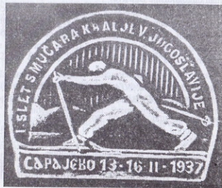
sl. 54: Značka prvog sleta

Jedan od najaktivnijih i najjačih klubova bio je Ski-klub Sarajevo. Ovaj klub je učestvovala 27. i 28. februara 1939. godine na velikom smučarskom takmičenju Srbije na Kopaoniku. Tadašnji sarajevski časopisi posvetili su veliku pažnju ovom smučarskom